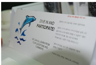
(사진 설명: 2009년 3월 20-21일 열린 오픈 워크샵 중)